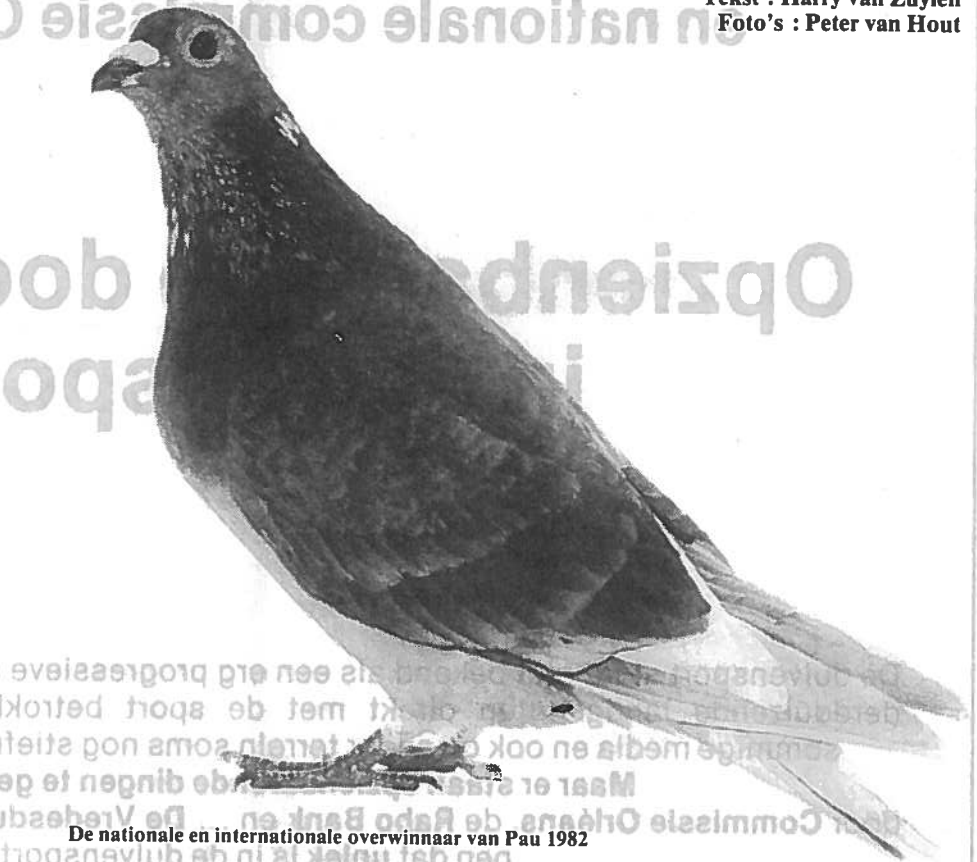
De nationale en internationale overwinnaar van Pau 1982