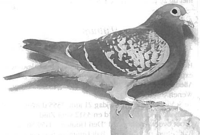
"De Oude Frans".

de geschiedenis met hitte en kopwind, werd hij bij de slechtste ligging 2e bondskampioen van de grote N.A.B.v.P.. De mooiste prestatie van Burgers was het winnen van de zo